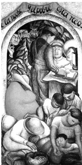
El sueño de la noche de los pobres. Por Diego Rivera