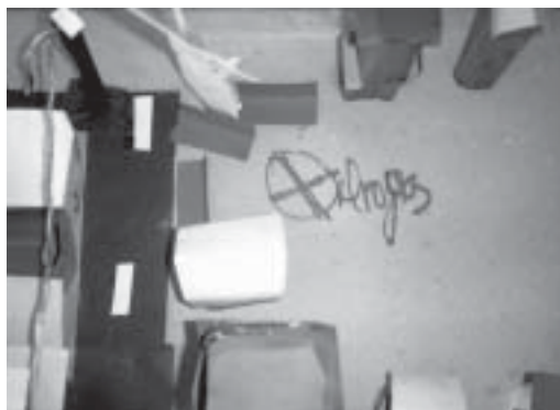
Maqueta realizada por estudiantes de 8 vo grado de la escuela de Los Mameyes, Santo Domingo, República Dominicana. Se identifican los puntos de distribución de drogas en el barrio.

El mapeo es una herramienta muy didáctica, porque permite utilizar los recursos que existen en el medio. Por ejemplo, los mapas de la comunidad o entornos geográficos del centro educativo se pueden realizar sobre papel y cartulina, pero también se puede crear un mural en las paredes o en la verja de la escuela o incluso en las mismas paredes del interior de la escuela. Pero si el centro cuenta con mucho terreno, se puede recrear el mapa de la comunidad en el suelo, utilizando piedras, palos, semillas y hasta las cajas de la leche del desayuno escolar para representar las casas de la comunidad. Cuando un niño o una niña visualiza su construcción de muchas piedras o cajitas pegadas representando su casa y la de sus vecinos y visualiza grandes cantidades de tierra delimitadas por palitos representando las fincas de los grandes propietarios, les pueden surgir preguntas muy interesantes sobre cómo están distribuidos los bienes materiales de su contexto.