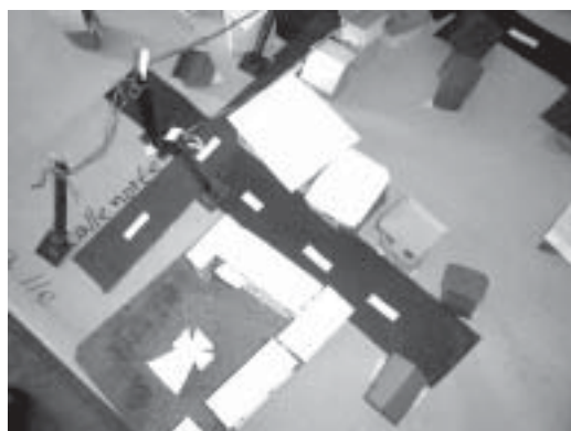
Maqueta realizada por estudiantes de 8 vo grado de la escuela de Los Mameyes, Santo Domingo, República Dominicana. Se observa la calle y el edificio de la escuela en forma de L con la iglesia al centro.

comunidad de forma ideal; despertando en los y las niñas el sentido de pertenencia a su comunidad y de compromiso a trabajar por la misma.